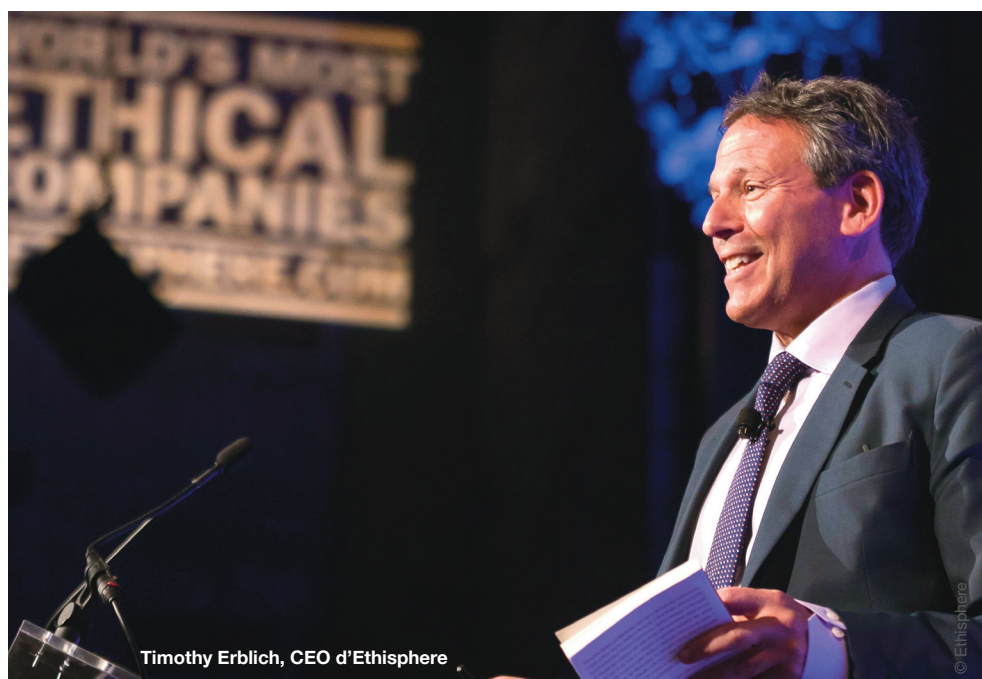
Timothy Erblich, CEO d'Ethisphere

Depuis 11 ans, le magazine américain Ethisphere, publication du think tank new-yorkais du même nom, dresse chaque année une liste des entreprises les plus éthiques du monde. Ce classement permet aux entreprises de choisir, secteur par secteur, les partenaires les plus à la pointe dans ce domaine. Les efforts fournis par les entreprises et par l'institut américain forcent à la fois l'humilité et la réjouissance puisqu'ils ont contribué à sans cesse élever les standards de comportement des entreprises.